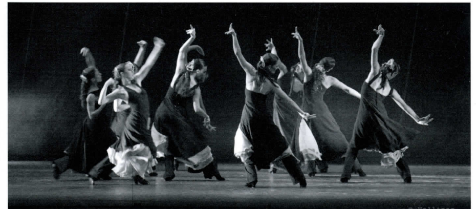
"Moreas": Fotografía de Jesús Vallinas

Entre los galardones que ha recibido el Ballet Nacional de España se pueden destacar el Premio de la Crítica al Mejor Espectáculo Extranjero representado durante la temporada 1988 en el Metropolitan de Nueva York; Premio de la Crítica Japonesa, en 1991; Premio de la Crítica al Mejor Espectáculo presentado en 1994 en el Teatro Bellas Artes de México y el Premio del periódico El País (Tentaciones) al espectáculo "Poeta", como la mejor coreografía presentada en España durante 1999. En marzo de 2002, el BNE ha recibido los premios de la crítica y del público por la coreografía "Fuenteovejuna" de Antonio Gades, en el VI Festival de Jerez.